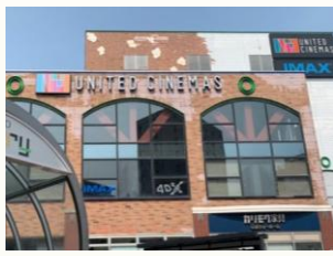
【ユナイテッドシネマズ】