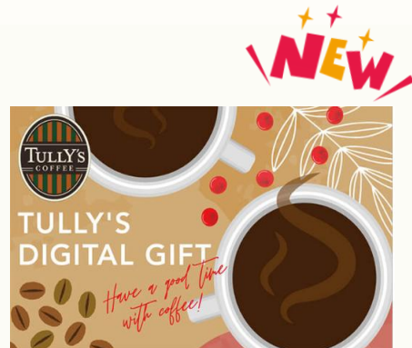
【タリーズコーヒーデジタルギフト】