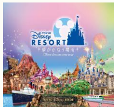
【東京ディズニーリゾート (R)・コーポレートプログラム 500円利用券】