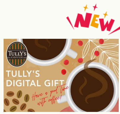
【タリーズコーヒーデジタルギフト】