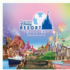
【東京ディズニーリゾート (R)・コーポレートプログラム 500円利用券】