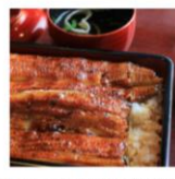
特大 鹿児島県産うなぎ蒲焼セット (永谷園お吸い物付)