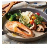
キングサーモンスターキ