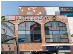
【ユナイテッドシネマズ】