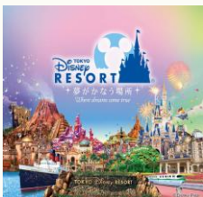
【東京ディズニーリゾート (R)・コーポレートプログラム 500円利用券】