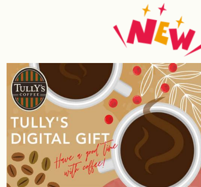
【タリーズコーヒーデジタルギフト】