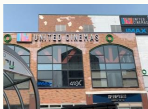
【ユナイテッドシネマズ】