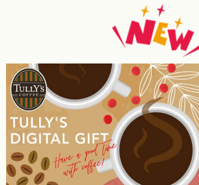
【タリーズコーヒーデジタルギフト】