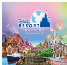
【東京ディズニーリゾート (R)・コーポレートプログラム 500円利用券】