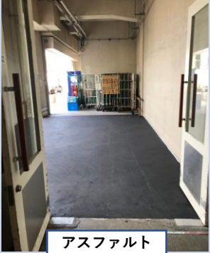
アスファルト 施工後