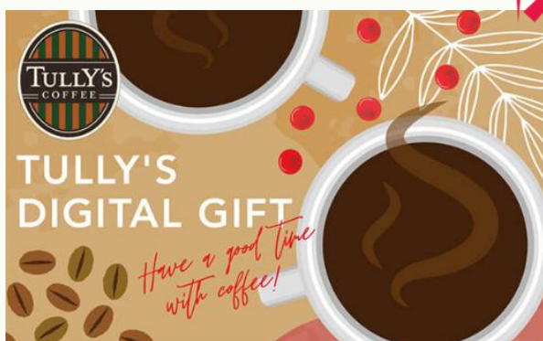
【タリーズコーヒーデジタルギフト】