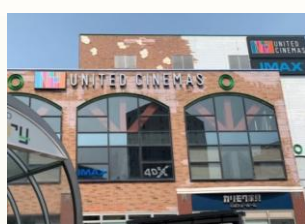
【ユナイテッドシネマズ】