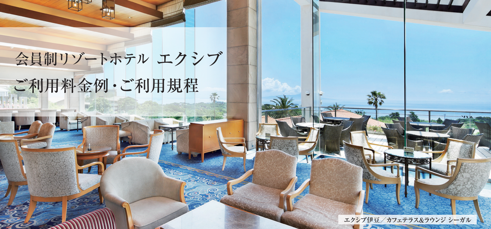
エクシブ伊豆 / カフェテラス&ラウンジ シーガル