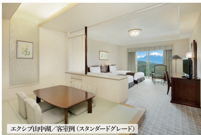
エクシブ山中湖 / 客室例(スタンダードグレード)