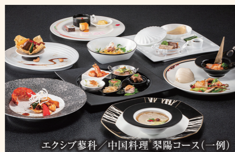
エキシブ蓼科/中国料理 翠陽コース(一例)