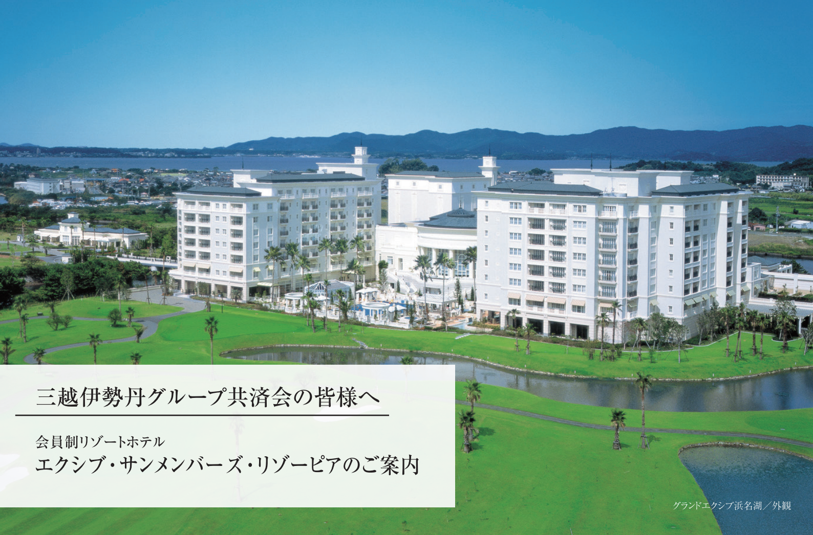
グランドエクシブ浜名湖／外観