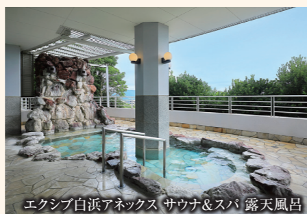
エキシブ白浜アネックス サウナ&スパ 露天風呂