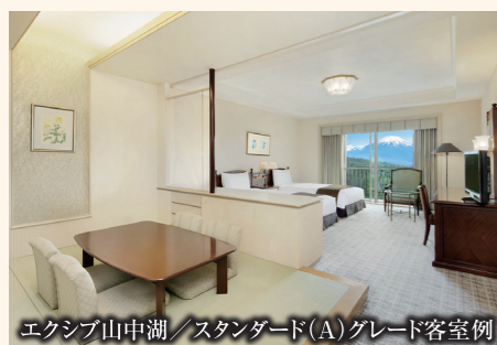
エキシブ山中湖/スタンダード(A)グレード客室例

※那須白河 ザ・ロッジ、鳴門 ザ・ロッジのツインをご利用時は15,500円(税サ込)