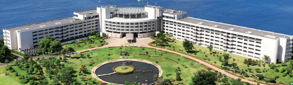
エクシブ初島クラブ / 外観