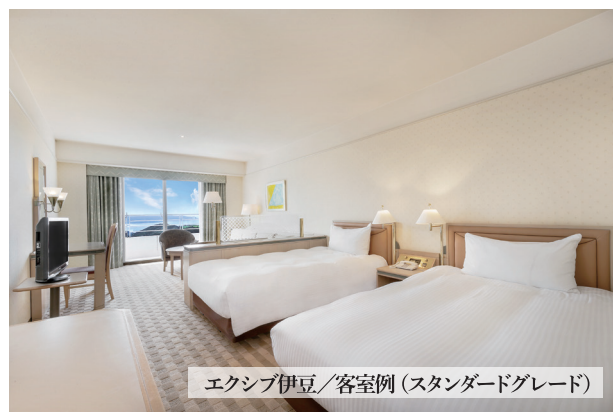
エクシブ伊豆 / 客室例(スタンダードグレード)