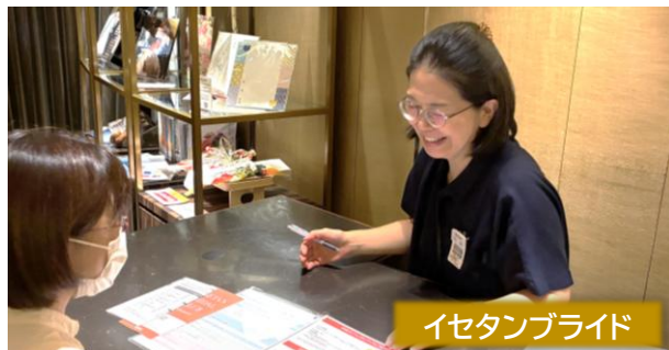
イセタンブライド

ギフト・商品券・ブライダルのチームごとに上下連休表を回 しています。半期最大3週取得可能で端数取得もでき ます。残業が発生した場合もショート・ロングの制度を 活用する働き方や、時間単位の休暇取得が定着してき ました。