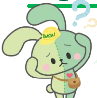
<イングちゃん> IMGU公式マスコット キャラクター