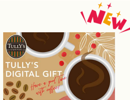
【タリーズコーヒーデジタルギフト】