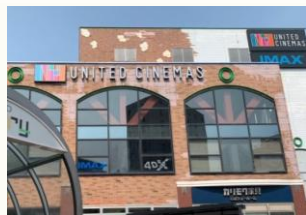
【ユナイテッドシネマズ】