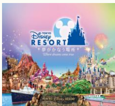
【東京ディズニーリゾート (R)・コーポレートプログラム 500円利用券】