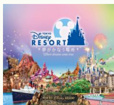
【東京ディズニーリゾート (R)・コーポレートプログラム 500円利用券】