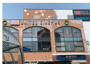
【ユナイテッドシネマズ】