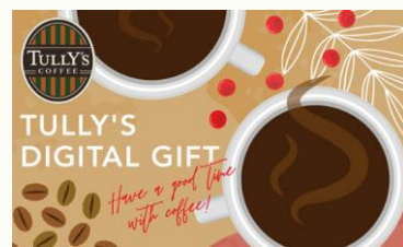
【タリーズコーヒーデジタルギフト】