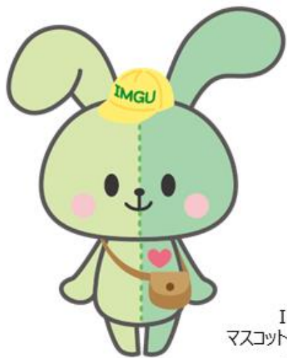
IMGU公式 マスコットキャラクター イングちゃん