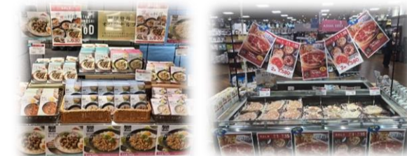
ガバオライスの具・ルーロー飯の具

今年度、新規 PB 商品開発を強化し、売上シェアを高めていく方針が掲げられています。今後も開発・発売を加速させ、展開工夫による販促を行っています。