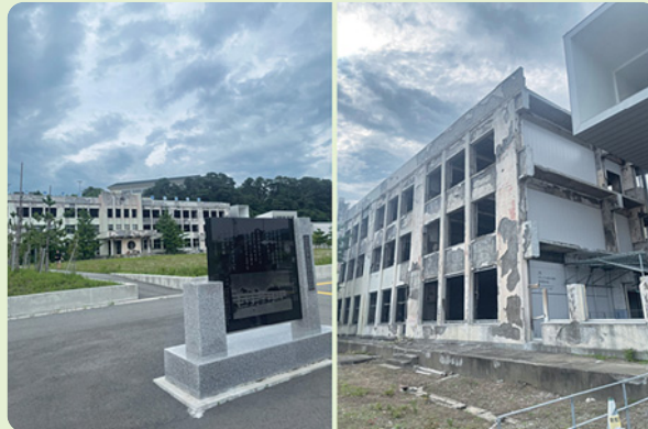
石巻市震災遺構 門脇小学校