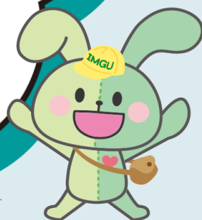
IMGU公式マスコットキャラクター イングちゃん

今夏も「愛の募金活動」を実施させていただきます。皆さまから、お預かりした募金は、大雨や地震などの災害によって被災されたグループ企業で働く方々などへのお見舞金の拠出に加え、「日本赤十字社」「UAゼンセン」を通じた被災者への寄付や救援活動支援にも活用させていただきます。ご協力の程よろしくお願いいたします。