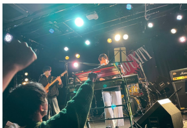
軽音サークルに入っていました！