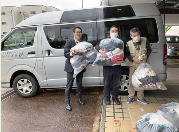
就労継続支援施設「新潟もぐら工房」 新潟市西区坂井 533-1 昭和45年養護学校卒業生の利用施設として開設。現在20数名の身体障がい者の方々が、ポリ袋作り、ウエス（機械の油を拭く布きれ）作りの作業を行っています。

4月2日(火)～4月27日(土)の約1ヵ月間、不要になった衣料の回収を実施しました。 毎回、大勢の皆さまよりお力添えをいただいている社会貢献活動です。 今回は本館・別館・各サテライトショップで 70Lポリ袋16袋(コンテナ約1.5台分) が集まり、5月8日(火)に新潟もぐら工房様へ寄付させていただきました。