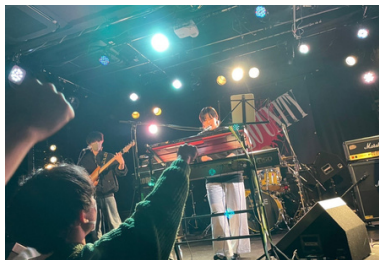
軽音サークルに入っていました！