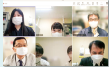
▲リモート会議の様子