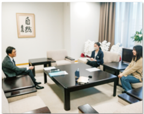
▲インタビューの様子

ラシックについても、相変わらずファッション感度の高い館を維持していると心強く感じました。