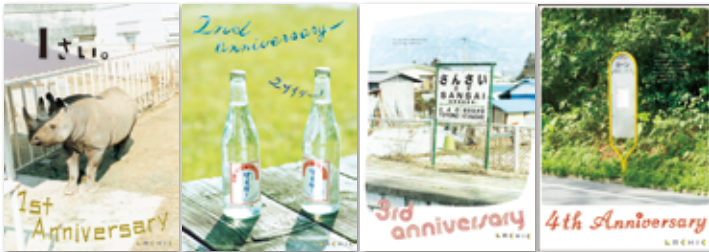
②ラシック1周年～4周年の広告ポスター