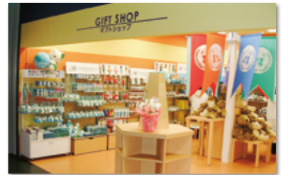
④国際連合パビリオンの公式売店を 三越が担当していました!