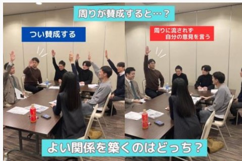
よい関係を築くのはどっち？