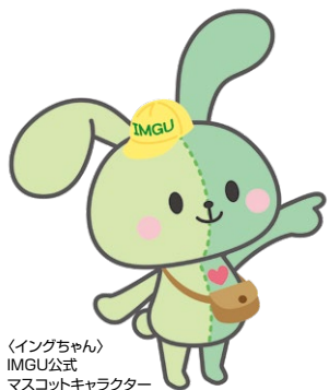
〈イングちゃん〉 IMGU公式 マスコットキャラクター