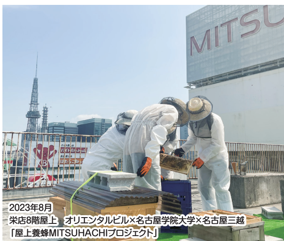
2023年8月 栄店8階屋上 オリエンタルビル×名古屋学院大学×名古屋三越 「屋上養蜂MITSUHACHIプロジェクト」