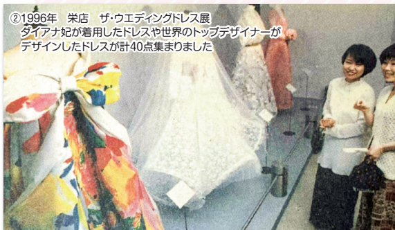
②1996年 栄店 ザ・ウエディングドレス展 ダイアナ妃が着用したドレスや世界のトップデザイナーがデザインしたドレスが計40点集まりました