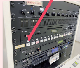
▲店内BGMを管理する機器