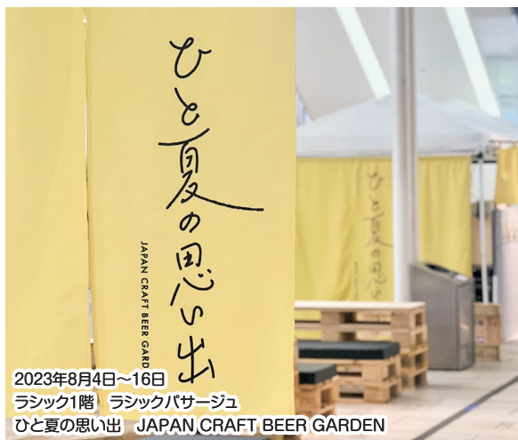
2023年8月4日~16日 ラシック1階 ラシックパサージュ ひと夏の思い出 JAPAN CRAFT BEER GARDEN