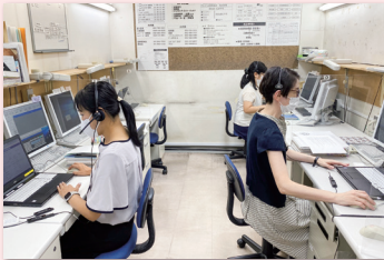
▲電話交換をおこなうスペース