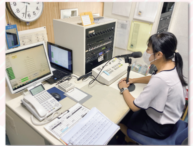
▲店内放送をしている様子です!