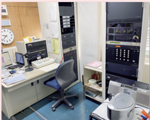
▲店内放送をおこなうスペース