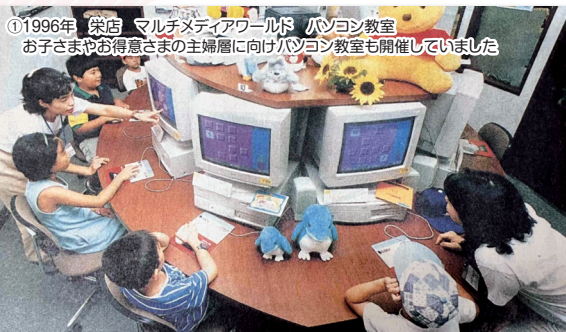
①1996年 栄店 マルチメディアワールド パソコン教室 お子さまやお得意さまの主婦層向けパソコン教室も開催していました

当コーナーでは1980年の名古屋三越誕生から、5年ずつ当時の画像や年表を使用しご紹介していきます♪ また当時新入社員で入社した方に当時の会社についてインタビューしました!