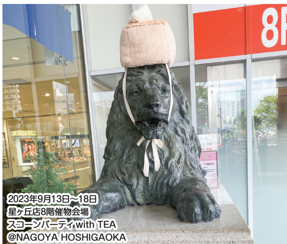
2023年9月13日~18日 星ヶ丘店8階催物会場 スコーンパーティーwith TEA @NAGOYA HOSHIGAOKA