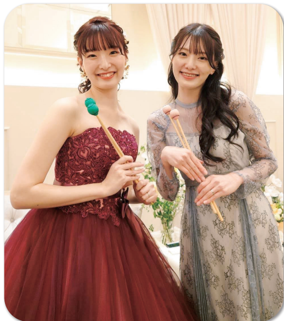
▲姉(画像左)の結婚式の画像です! 打楽器を演奏しました!

SixTONESとSexyZoneが大好きです!ライブのために今日も頑張りますので、メンバーとお知り合いの方がいましたらこっそり紹介してください! 笑