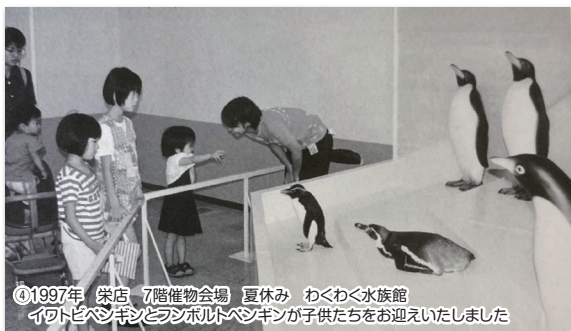
④1997年 栄店 7階催物会場 夏休み わくわく水族館 イトロペンギンとジャンボイトペンギンが子供たちをお迎えしていました