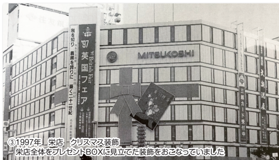
③1997年 栄店 クリスマス装飾 栄店全体をプレゼンTBOXに見立てた装飾をおこなっていました