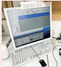
▲電話交換専用の機器