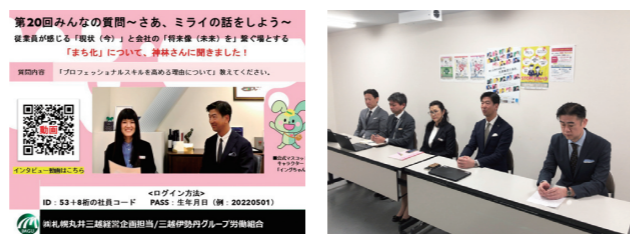
社長インタビュー(札幌)

【主な活動】経営懇話会(経営対話)、職場懇話会(所属長対話) 【重点ポイント】雇用・労働条件維持の前提となる企業存続や発展、それらに繋がる経営戦略の精度向上、現場課題解決の活動に取り組む