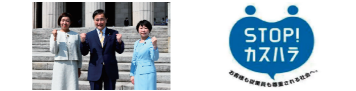
組織内参議院議員

【主な活動】上部団体(UAゼンセン)組織内議員と連携した政策(流通業・百貨店で働く人達の労働条件、働く環境改善)推進活動等