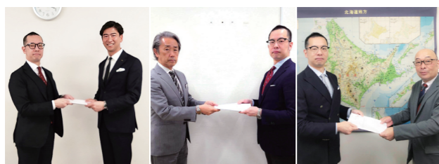
労使協議会(札幌・函館・百科)

【主な活動】労使協議会(春の交渉等)、労使部会(通年協議等)、安全衛生委員会、時間管理委員会、ハラスメント防止対策委員会 【重点ポイント】労働条件の維持・向上、中長期的働きがい・働きやすさを高める仕組みや働く環境整備、目標となる労働条件を描く活動に取り組む