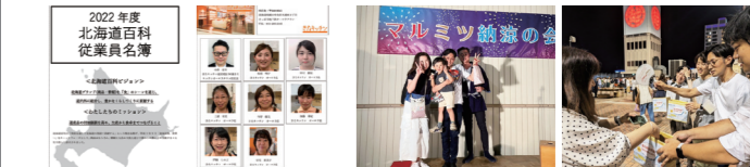
従業員名簿(札幌・百科)