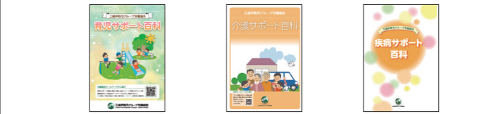
育児サポート百科