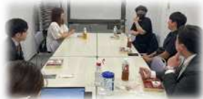
第3 職場区職場委員会