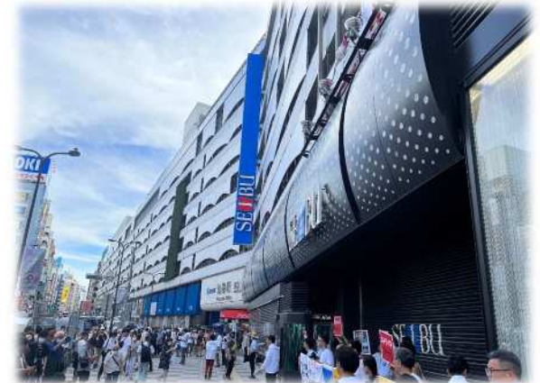
西武池袋本店前での街頭行動の様子