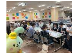
23年9月アロマイベント