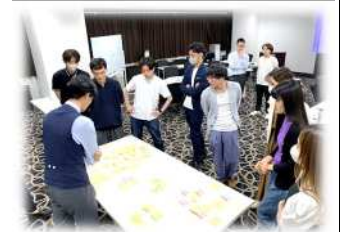
労働条件ロードマップを議論！ 札幌丸井三越（上）と松山三越支部（下）