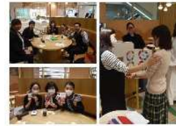
22年10月ダンロお茶会

振り返り：組合主導の企画を積極的に実施、従業員同士の交流の場を設けた 今後の課題：アフターコロナにおける環境変化に対応した多様な活動の推進