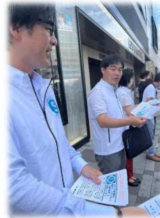
西武池袋本店前でのビラ配り