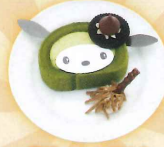
魔法のくちどけ★ 抹茶のスフレロールケーキ