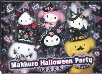
Makkuromi Halloween Party