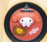
キュートにハロウィーン♡ ハンバーグピンクカレー