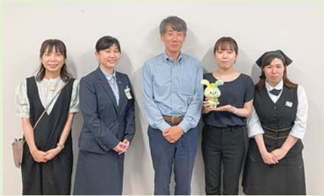
ご参加ありがとうございました！