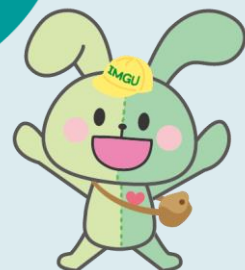
IMGU公式マスコットキャラクター イングちゃん

今夏も「愛の募金活動」を実施させていただきます。皆さまから、お預かりした募金は、 下記の本部支援団体に寄付・寄贈 をおこなうとともに、国内外の 災害発生時に被災者や救援活動の支援金 として活用されています。ご協力の程よろしくをお願いいたします。