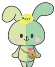
<イングちゃん> IMGU公式マスコット キャラクター