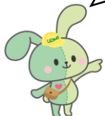
■公式マスコットキャラクター「インガちゃん」

インタビュー動画の視聴、感想・今後取り上げて欲しいテーマ等アンケートへのご協力をお願いします🙏