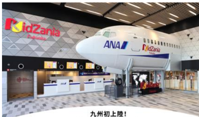
九州初上陸！ こどもが主役の街キッズニア

（ご購入いただける割引チケットの種類は、平日9:00～15:00までの6時間チケットのみになります。）