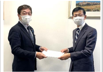
労使協議会にて要求書を提出し、満額回答をいただきました