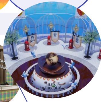
バーチャルサロン・デュ・ショコラ2023