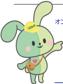
<イングちゃん> IMGU公式マスコットキャラクター

imPRESSでも紹介されている注目事業！今回はどんな働き方をしているのかを中心に伝えていこうよ～