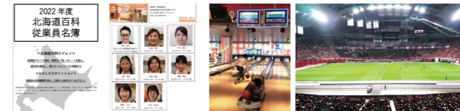
従業員名簿(札幌・百科)