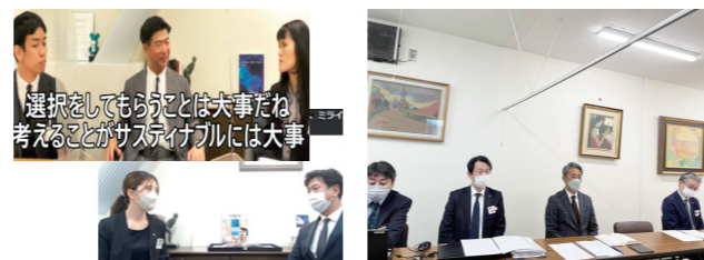
社長インタビュー(札幌)

【主な活動】経営懇話会(経営対話)、職場懇話会(所属長対話) 【重点ポイント】雇用・労働条件維持の前提となる企業存続や発展、各社の企業ビジョン実現や、経営戦略の実効性向上、現場課題の解決に繋げる