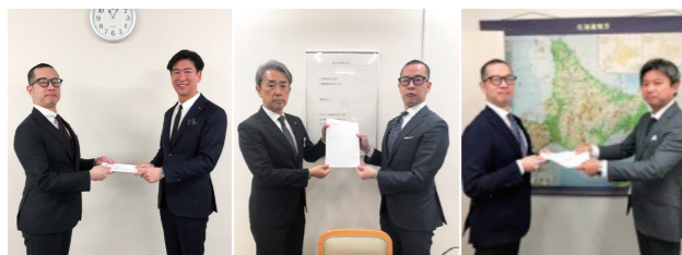
労使協議会(札幌・函館・百科)

【主な活動】労使協議会(春の交渉等)、労使部会(通年協議等)、安全衛生委員会、時間管理委員会、ハラスメント防止対策委員会 【重点ポイント】労働条件の維持・向上、中長期のやりがい、働きがいを高める仕組み整備