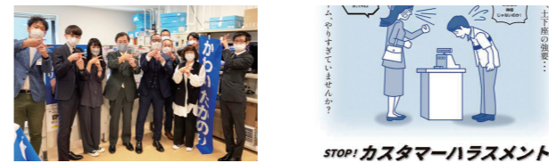
組織内議員(かわい参議院議員)

【主な活動】上部団体(UAZ)組織内議員との連携、政策(流通業・百貨店の働く環境改善)推進活動&支持者拡大