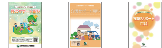
育児サポート百科