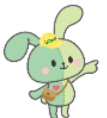
<イングちゃん> IMGU公式 マスコットキャラクター

「時間管理」のこと以外にも「私たちの考え方について」や「職場風土のこと」や「ハラスメントにこと」などいろいろ書いてあるうさね～