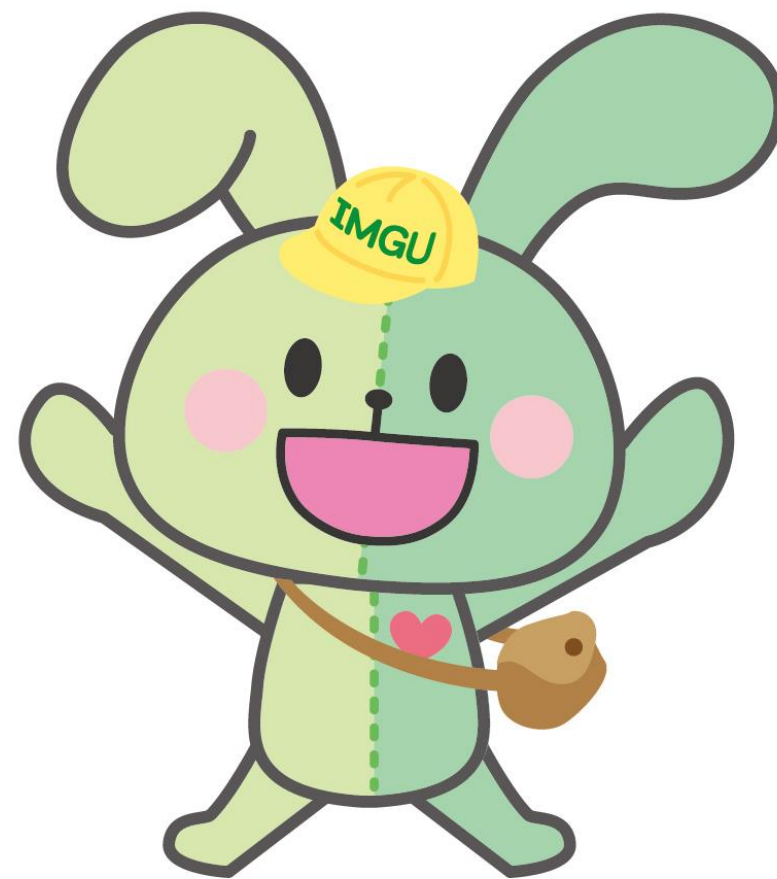
三越伊勢丹グループ労働組合（IMGU） 公式マスコットキャラクター イングちゃん

この機会にわたしたちを知っていただくことで、皆さんの組合活動への理解と参画が進めばとても嬉しく思います。