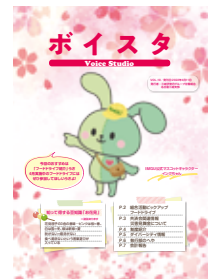
▲広報活動①ボイスタVOL.10

お預かりした組合費は期初に活動内容を組み立て、予算を設定し、メンバーの方のために役立てられているうさよ～