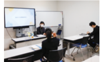
▲教育サポート活動①マナベルカフェ