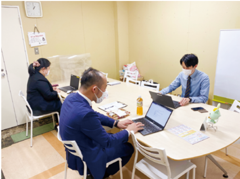
2022年5月評議員会の様子 適正な時間管理について議論しました。

評議員ってみんな知ってるうさ？ 現場のお困りごとを、 親身になって聞いてくれる方たちうさよ～