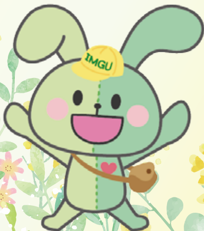
IMGU公式マスコットキャラクター イングちゃん