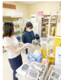
▲教育サポート活動 ②2022年度フレッシュプラン