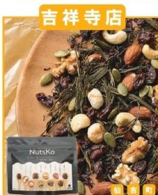
函館市(能戸フーズ) 無添加おやつ (70g)…721円 ナッツと昆布 Nutsko