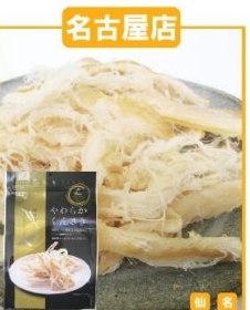
函館市(三友食品) やわらかくんさき (70g)…454円