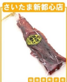
余市町(北海道京食) 鮭とば一番干し (180g)…1,235円