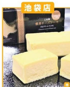
江別市(ジェイスイーツたしる屋) こな雪濃厚チーズケーキ (1箱)…1,275円