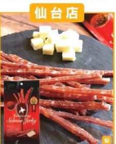
えりも町(マルデン) えりも鮭ジャーキー (35g)…324円