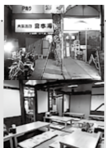
その②「大衆酒蔵 日本海」松戸店歓迎会の聖地！