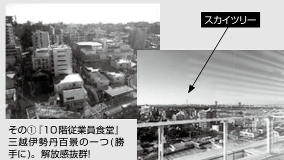
その①「10階従業員食堂」三越伊勢丹百景の一つ(勝手に)。解放感抜群！