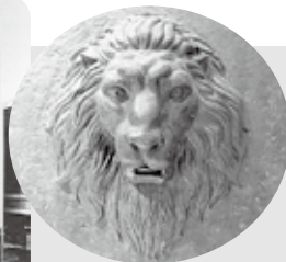
ニューナラヤ時代の もう一頭のライオン