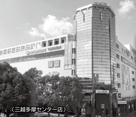
〈三越多摩センター店〉