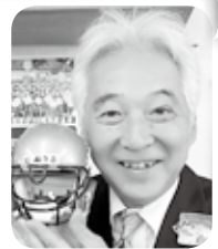
吉川販売サービス担当長

「お客さまがスタイリストに会いに来るお店を作ろう!」というテーマは永遠です。お客さまとの繋がりに感謝です。これからも、そしてこれからも。