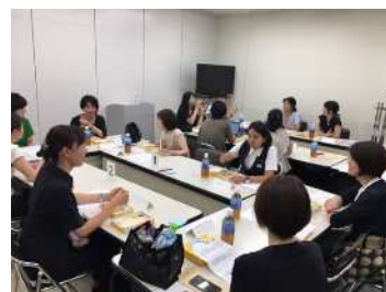
ワーキングファミリー VOICE