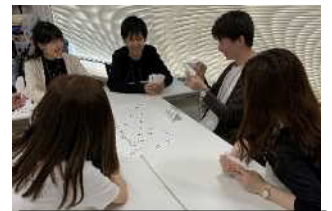
新卒フレッシュプラン(IMS 合同)