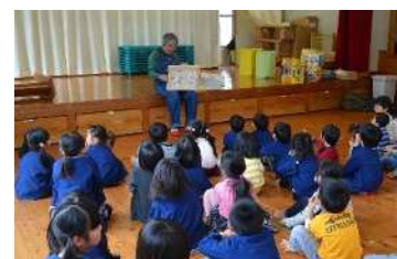
東峰村の保育園訪問