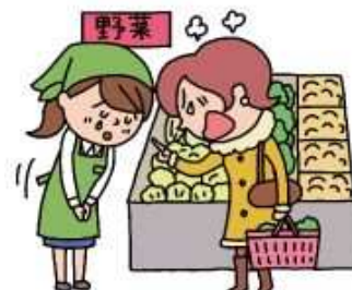
暴言や長時間拘束