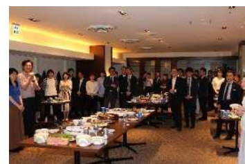
労使共催サマーパーティ