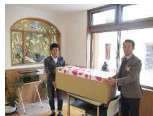
児童養護施設への物品寄贈