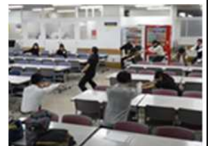
18.12 ライザップセミナー