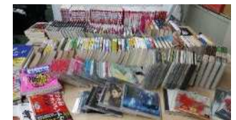
古本パワープロジェクト