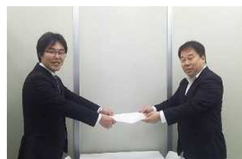
労使協議会 三越伊勢丹ギフト・ソリューションズ分会