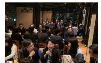
団結会(さよならハイジア)