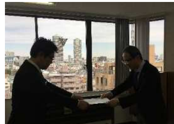
労使協議会 レオテックス直轄分会

● 労働福祉活動 ：法改正の対応やグループ制度など伴う内容をベースに労働協約改訂を行いました。