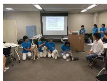
啓発型セミナー（動物愛護）