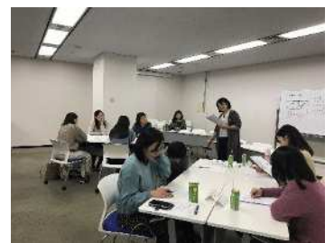
【テーマ別：育児休職者 VOICE】