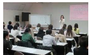
キャリアセミナー