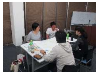
ミドルライフサポート