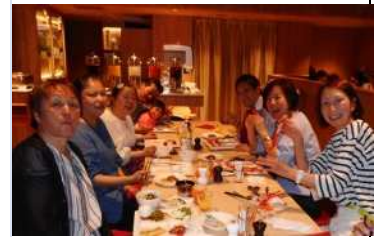
IMBS ホテルランチレク