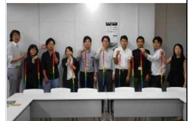
関連 I 折鶴の取り組み