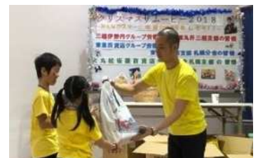
羊ヶ丘養護園の支援