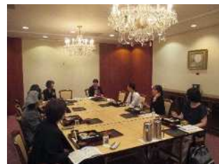
ワーキングファミリーVOICE