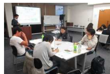
3支部合同 ミドルライフサポート研修