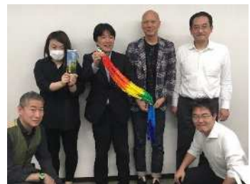
USR 活動 平和を願う折鶴作成