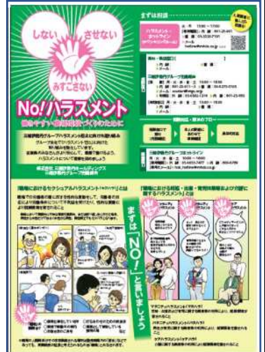
<ハラスメントリーフレットの発刊>