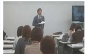
VOICE 活動(メンバーズ VOICE)