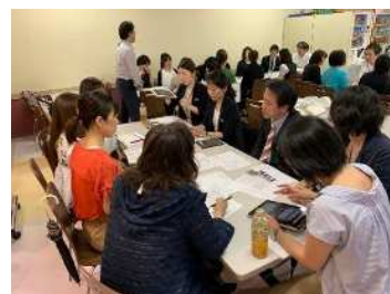
相模原店・府中店情報交換会