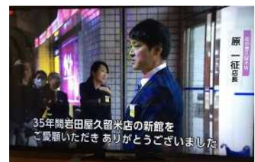
岩田屋久留米店新館営業終了