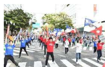
博多どんたくパレード