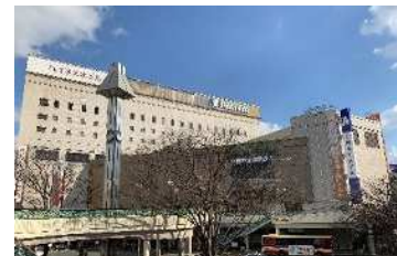
岩田屋久留米店新館