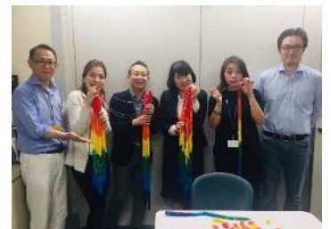
広島平和記念式典 折鶴献納