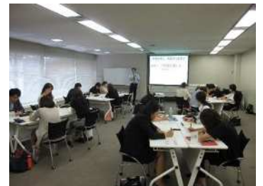
IMH・IMS セカンドプラン

・組合活動の背景やその意義を理解し、各活動の推進に向けて取り組んできましたが、若手社員を中心にその理解度については課題を残しています。