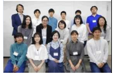
関連 I 新卒対象合同フレッシュプラン