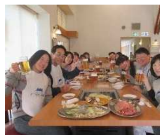
ビール工場見学レクリエーション