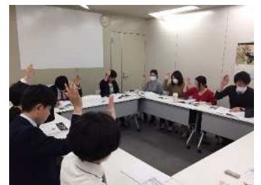
スタジオアルタ総会