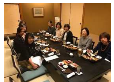
【レク：有名ホテル・レストラン体験】