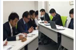
経営対策活動(経営懇話会)