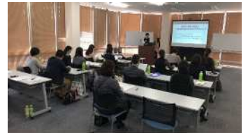
三支部合同ミドルライフサポート