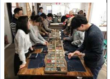
岡山・倉敷デニムを学ぶツアー