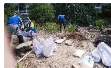
豪雨災害ボランティア