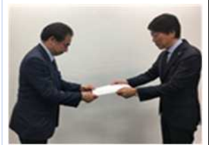
労働福祉活動(労使協議会)