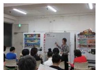
レク「手相占い体験教室とミニ鑑定」