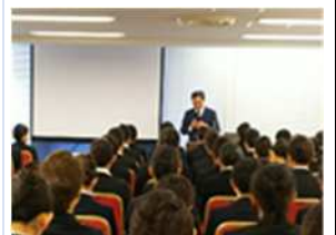
教育サポート活動(フレッシュプラン)