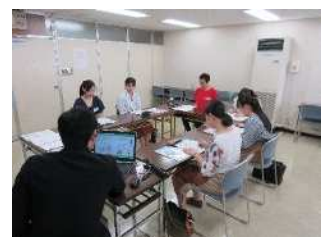
フレッシュプラン