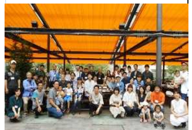
IMPD ピアガーデンレク