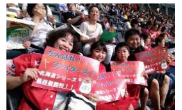
道産子スポーツ応援レクリエーション