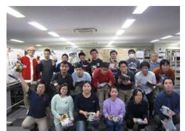
三越伊勢丹ソレイユクリスマス会