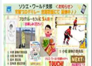
広報活動(支部ブログ)