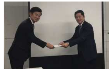
【経営対策：労使協議会】