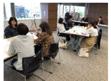
【教育：新卒入社2年目研修】