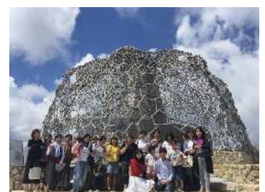
店休日バスツアー