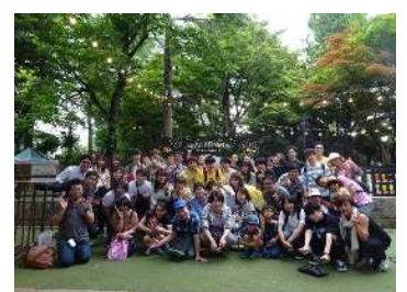
IMS 新人歓迎 バーベキュー