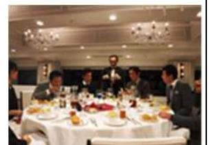
18.12 テーブルマナーセミナー