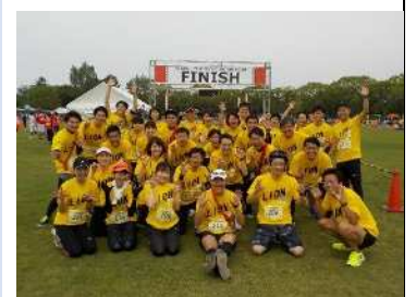
豊川リレーマラソン