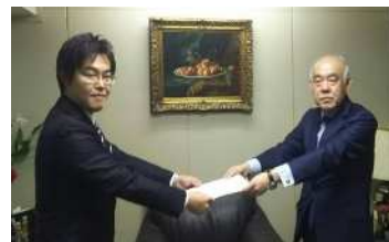
労使協議会 センチュリー・トレーディング分会