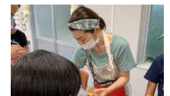
なかよし会(お祭り支援)