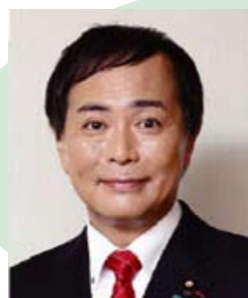
かわい たかのり 川合 孝典 組織内国会議員 参議院議員