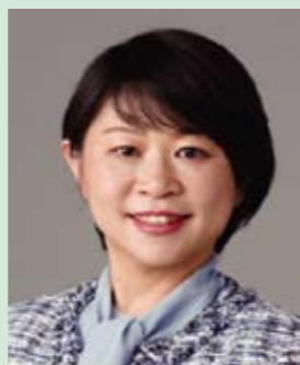
たむら 田村 まみ 組織内国会議員 参議院議員

かわいたかのり 公式ホームページ https://kawai-takanori.jp/