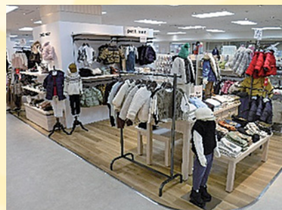
🎯 リモデルによって新たに3ブランドが仲間入りしました。左より「ズッカ」「ポールスミス」「プティマイン」